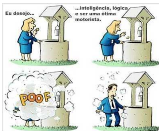
FIGURA 1 – Charge Com Piada Machista Sobre Mulher ao Volante.