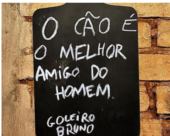
FIGURA 2 – Postagem da Rede Social do Restaurante.