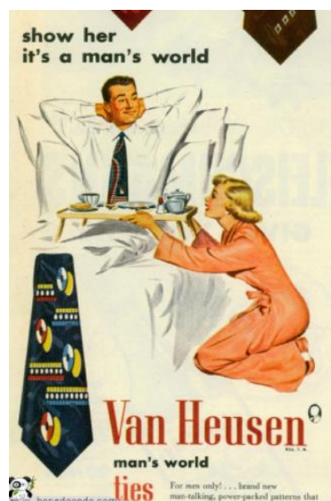
FIGURA 3 – Propaganda que Demonstra a Submissão da Mulher ao Homem.