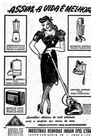
FIGURA 4 – Propaganda que Sugere o Trabalho Doméstico e Submissão das Mulheres.