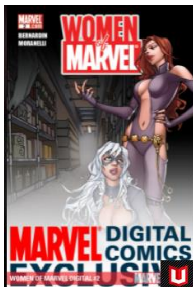
FIGURA 7 – Variante da Capa dos Quadrinhos “Mulheres da Marvel: Medusa” do ano de 2010 (dois mil e dez).