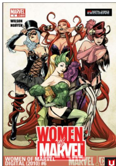
FIGURA 6 – Capa dos Quadrinhos “Mulheres da Marvel: Medusa” do ano de 2010.