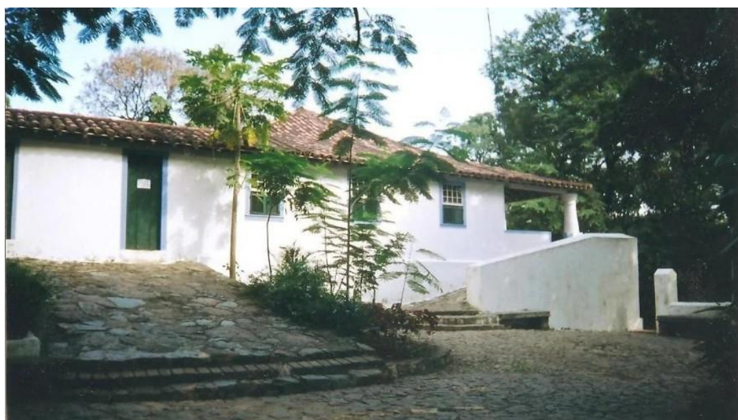
Fazenda do Viegas - Foto: Reprodução/Noph

O seguinte trabalho apresenta o método construtivo utilizado na Arquitetura do período colonial, focada na construção das casas-grandes remanescentes dos engenhos de açúcar. Usamos como exemplo a Fazenda do Viegas que fica localizada no Rio de Janeiro. (imagem 01)