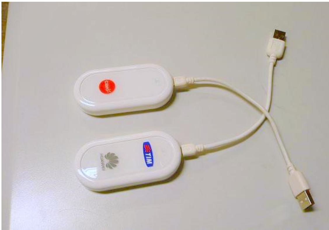
FIGURA 3: Modem 3G.

transmissão de sinal. E como mencionado anteriormente, a estrutura que abrange a tecnologia 3G ainda é precária no Brasil, interferindo muito no resultado final para os usuários da mesma.