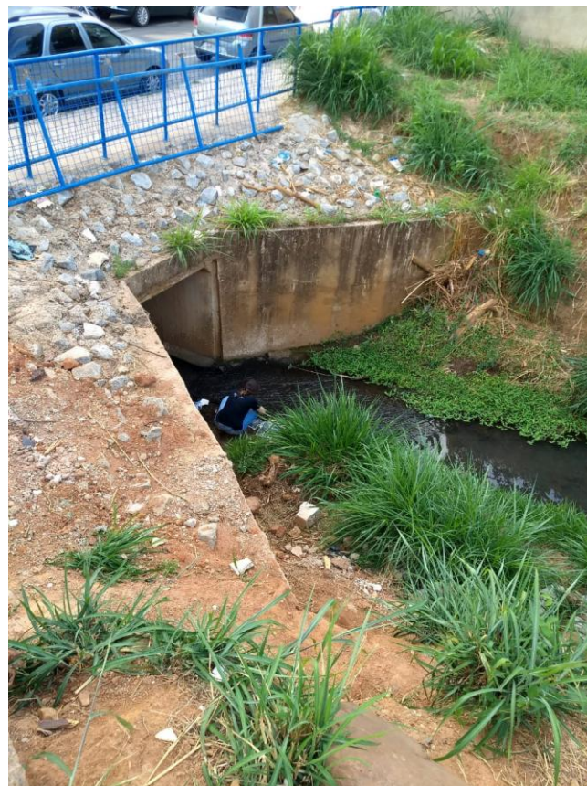
Figura 02: Trecho Canalizado do Córrego Cercadinho no Bairro Buritis, Belo Horizonte.

As análises de imagens e bancos de dados foram acompanhadas de visitas in situ para levantamento ambiental da sub-bacia, quando foram catalogados dados como: localização, vegetação, geomorfologia e uso do solo, além de registros fotográficos e identificação dos principais impactos e sua natureza (Figuras 02, 03).