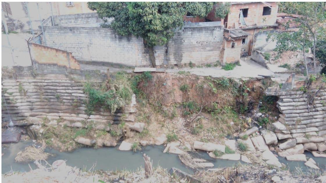
Figura 05: Construções A Margem Do Córrego.

A ocupação irregular nessa região causada pela expansão urbana desordenada, culminou nas construções irregulares de casas nas margens, o que as torna sujeitas a inundação e causam assoreamento dos recursos hídricos em função de solo exposto e margens sem vegetação como apresentado nas figuras 5, 6 e 7.