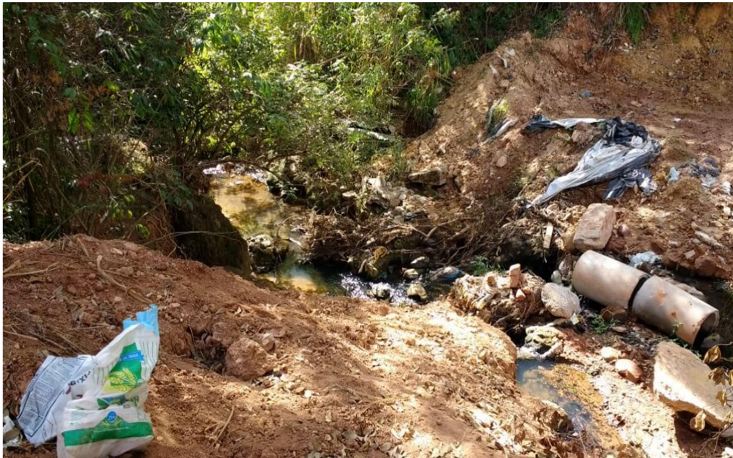
Figura 03: Curso d'água do Córrego Cercadinho no Bairro Havaí, Belo Horizonte