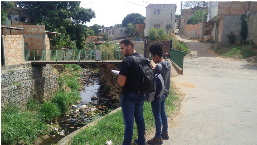
Figura 06: Margens Do Córrego.