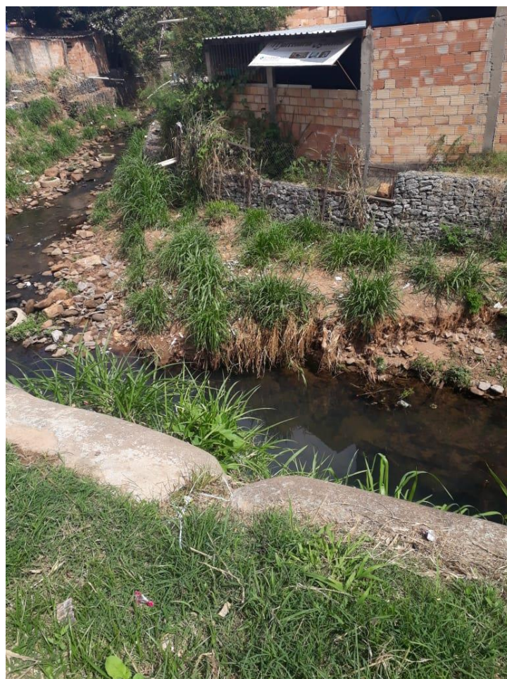
Figura 07: APPs ocupadas por moradias irregulares.