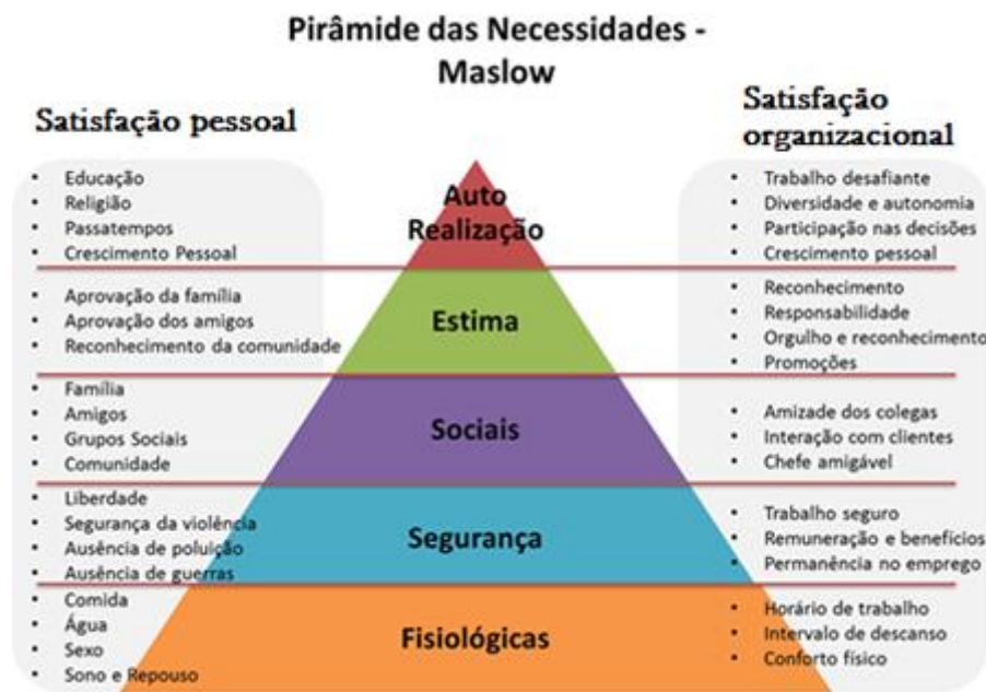
FIGURA 2: Pirâmide das Necessidades - Maslow.