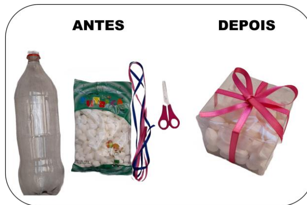
Figura 3 - Amostras de produto confeccionado com garrafa pet